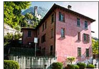
Casa Cattaneo a Castagnola

Per il suo impegno, le autorità ticinesi lo ricompenseranno nel 1858, accogliendolo come cittadino onorario.